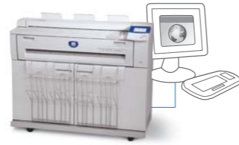
Digitaler Kopierer/Drucker mit Scan-to-File/Scan-to-Net-Funktion